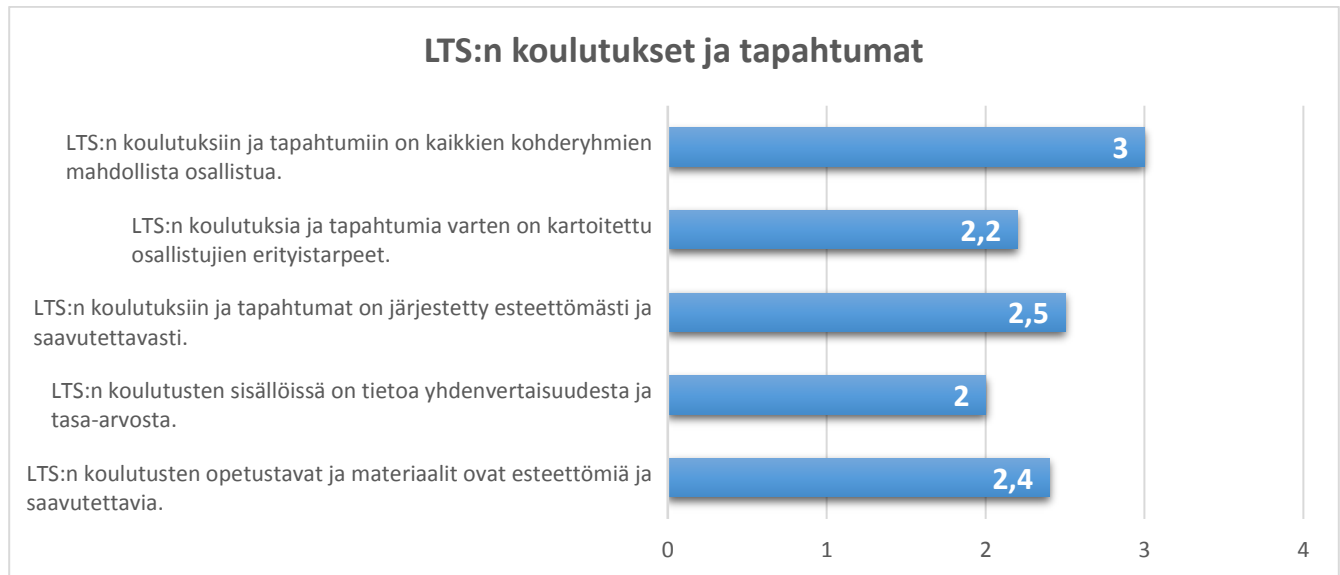
Kaavio 2. LTS:n koulutusten ja tapahtumien yhdenvertaisuus ja saavutettavuus (Arviointiasteikko: 1= toteutuu heikosti, 2=toteutuu tyydyttävästi, 3=toteutuu melko hyvin, 4=toteutuu erittäin hyvin).

osallistua LTS:n järjestämiin koulutuksiin ja tapahtumiin toteutuu melko hyvin. Tapahtumat on järjestetty myös melko esteettömästi ja saavutettavasti (2,5). Koulutusten ja tapahtumien sisällöissä on yhdenvertaisuus ja tasa-arvo-asiat ovat esillä tyydyttävästi (kaavio 2). Avoimissa vastauksissa nostettiin esille tapahtumien hinta, joka voi muodostua osalle halukkaista osallistujista liian suureksi ja olla este yhdenvertaiselle osallistumiselle.